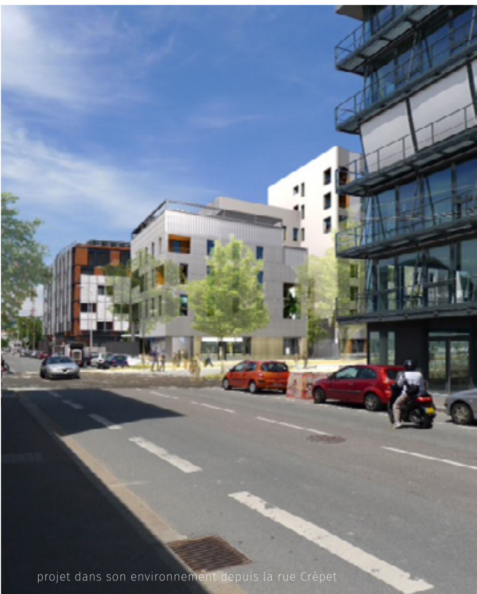
projet dans son environnement depuis la rue Crépet