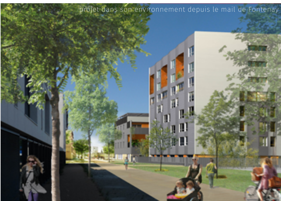
projet dans son environnement depuis le mail de Fontenay